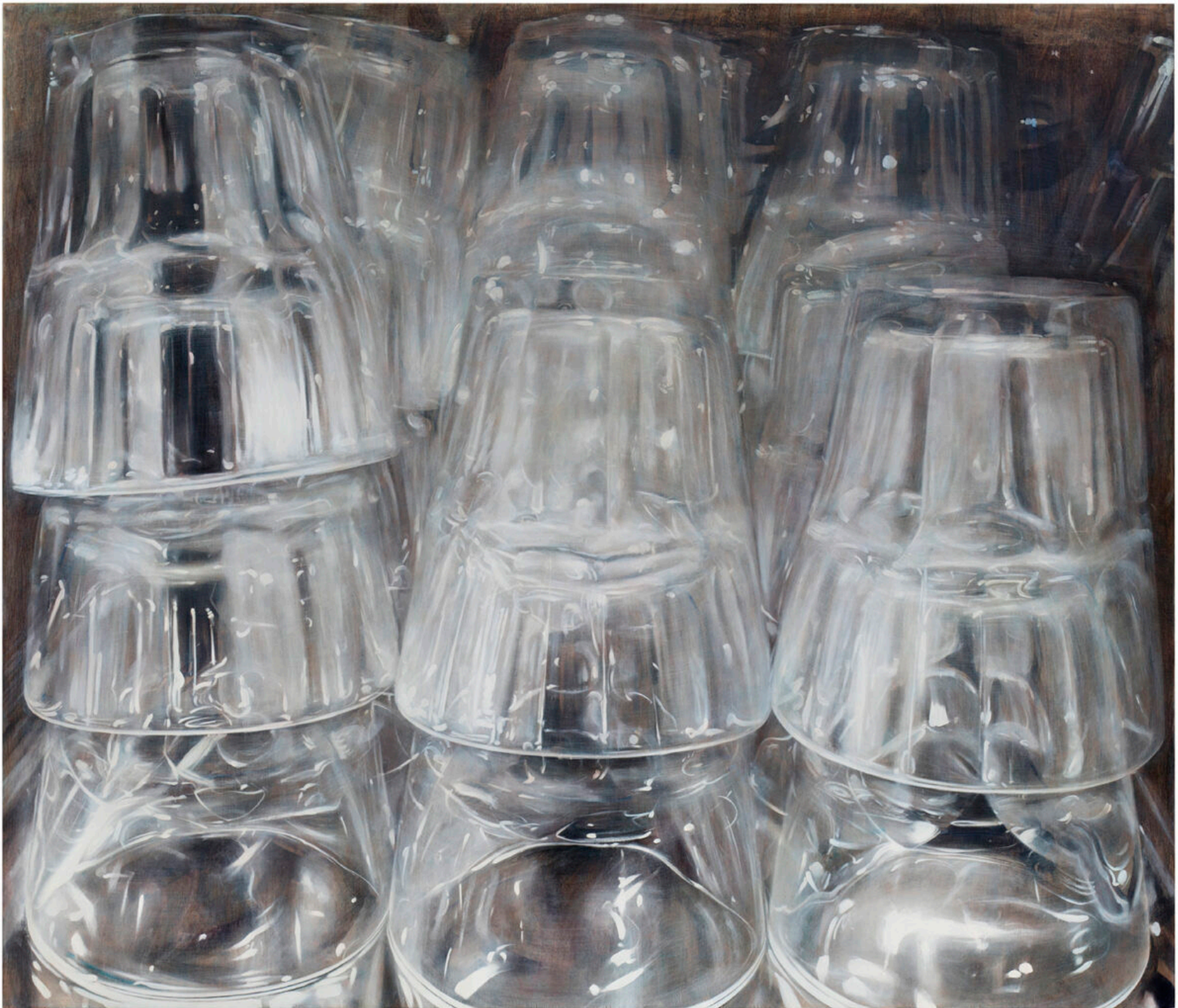
SUSANNE GOTTBORG, Ei voi tietää ovatko he olemassa vai vain näkyvissä / One can not tell if they exist or if they are just visible Öllyväri ja värikynä puulle, 2020, © Kuvasto 2022